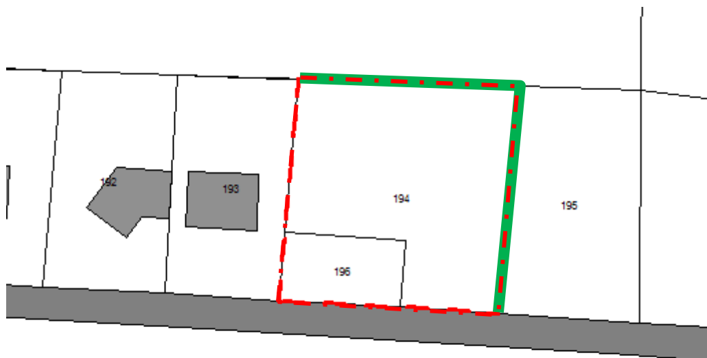
Schéma des principes :